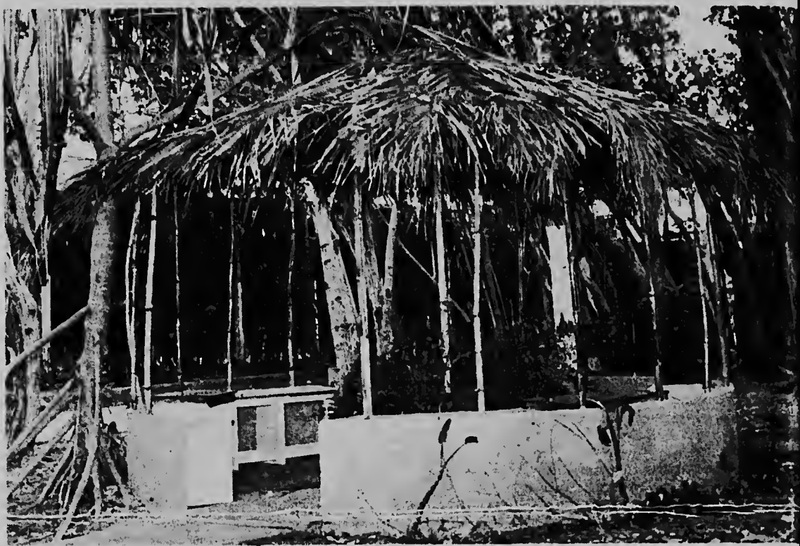
Na primera vista e foto aki ta pone nos corda riba un casita den un of otro selva inmenso, pero realidad e no ta nada cu e "Gazabo" (hukl' scondi) di "Madiki Country Club"

Personanan cu ta interesa pa bira miembro di Madiki Country Club, tin cu yena formulario, cu ta obtenible na e club, y manda esaki pa e directiva. Famlanan